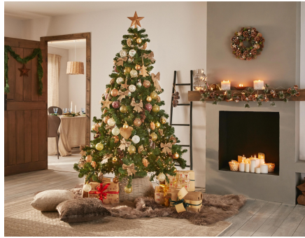
Raquel Pinedo 3ºB

La casa en la época de Navidad se viste de alegría, de luces y fiesta. Para impregnarla del espíritu de estas fechas, no puede faltar uno de los elementos ornamentales más simbólicos y bonitos: el tradicional abeto. Siempre hay un espacio para él.